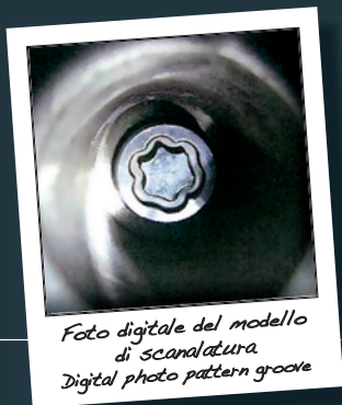
Foto digitale del modello di scanalatura Digital photo pattern groove

Of course you can also contact us in written form, by e-mail, by fax or by phone. Please use the following contact details: